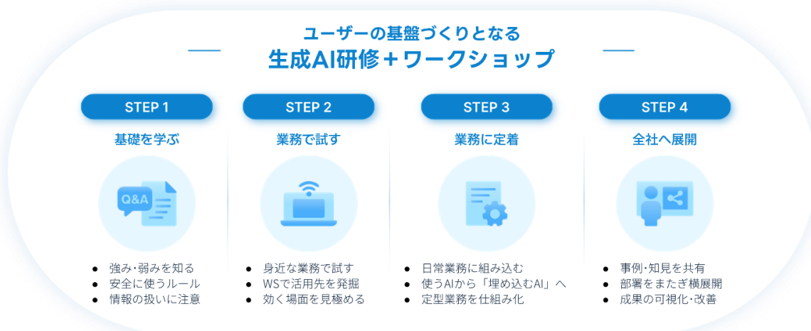
▲法人向け生成 AI 研修・ワークショップの流れ

※4) 2026/06/02 発表 「派遣スタッフへの生成 AI 実践研修を開始 実務直結型のオリジナル研修でスキル習得を支援」