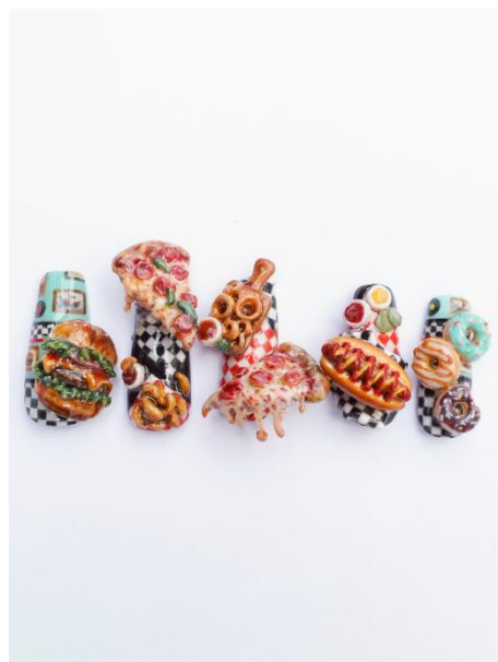
画像は2025年ジュニア部門最優秀作品