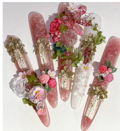
2025 年プロフェッショナル部門最優秀作品