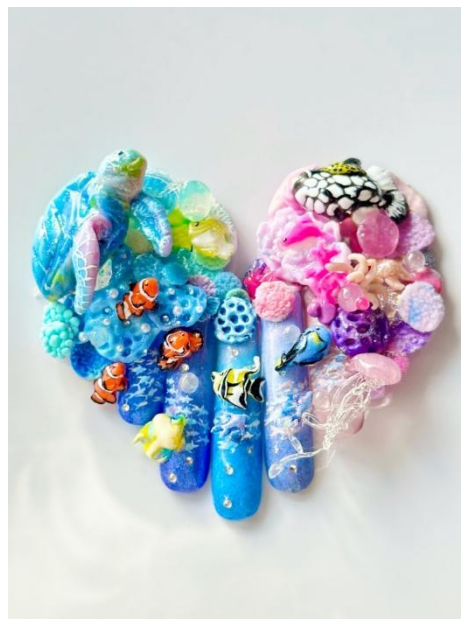
画像は2025年スチューデント部門最優秀作品

・入選（1名）：1万円相当の商品券、記念トロフィー、賞状、STORYJEL365 カラージェル 3色