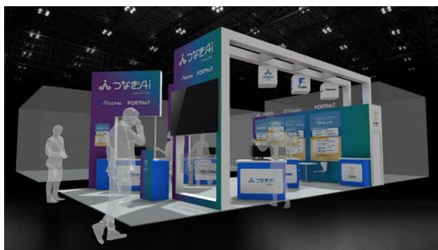
▲当社ブースイメージ：E22-18（東3ホール）