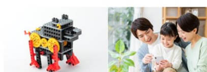
保護者さまから事務局へ

■ 本件に関するお問い合わせ ■ ヒューマンアカデミー株式会社 広報担当 斉藤 TEL : (03) 6863-9918 FAX : (03) 5389-8672 E-mail : ha_info@athuman.com