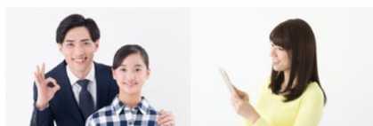
お子さまから先生へ