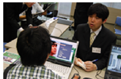
会社説明会・作品講評会風景(2012年7月開催時の写真)