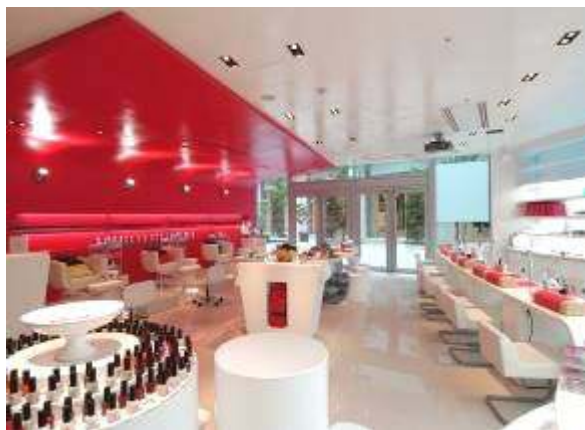
DASHING DIVA 汐留シティセンター店