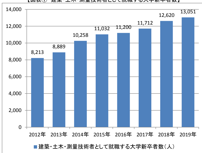
【図表① 建築・土木・測量技術者として就職する大学新卒者数】

文部科学省の「学校基本調査 令和元年度(2019年度)」の速報値によると、2019年3月に卒業し、建築・土木・測量技術者として就職した大学新卒者数は13,051人で、前年より3.4%増加しました。過去の推移を見ると、毎年増加し続けており、厳しい人材不足や高齢化の進展を背景に、建設業各社が大学新卒の採用を年々強化していることが分かります（図表①）。