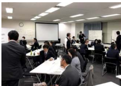
▲ヒューマングループ管理職を対象とした生産性向上に向けたマネジメント研修

当社グループ全体では、労働時間の使い方を抜本的に見直し、時間あたり生産性を向上させていきます。そのために、業務の効率化、システム化を積極的に推進し、社員の労働時間を削減するとともに、多様な働き方を実現していきます。