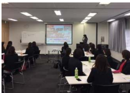
▲ヒューマンアカデミーが独自に実施している女性社員向け研修