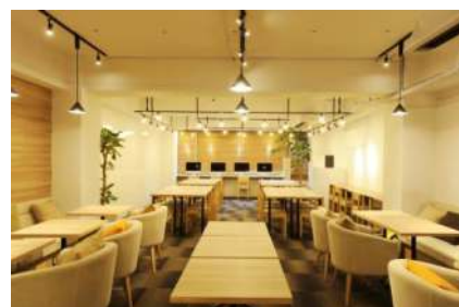
※写真は shibuya CDC

【申込先】 https://careerlog.doorkeeper.jp/events/49035