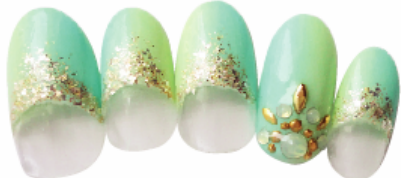
▼10,500 円 HAND ジェルデザイン