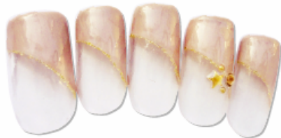
▼7,350 円 HAND ジェルデザイン