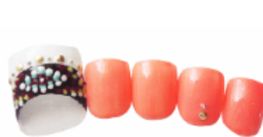
▼8,925 円 FOOT ジェルデザイン