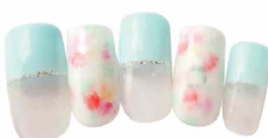
▼8,925 円 HAND ジェルデザイン