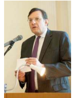
サー・ディビット・ウォレン駐日大使

ヒューマンアカデミーが日本初の認定スクールとして発足してから、すでに300名以上の資格認定 者を出しました。これを機に今後、BTEC が日本での認知度が高まること、日本の BTEC 認定者が グローバルに通用する人材として、保育の現場で一層活躍していただくことを期待しております。