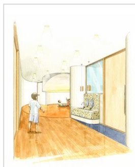
▲浦和保育園 イメージ