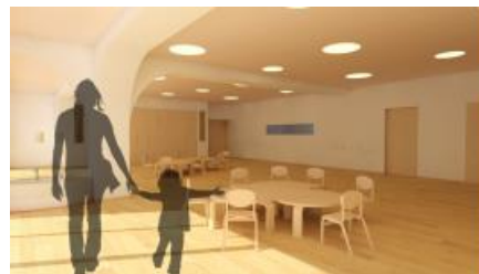
▲高津ナーサリー イメージ